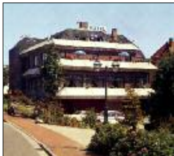
Hotel "Deutsches Haus"

Hunde können kostenfrei mitgebracht werden.