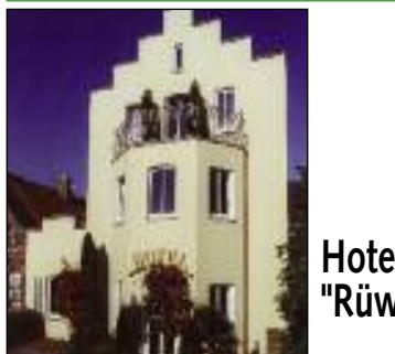
Hotel - Restaurant "Rüwe" ***S

Nichtraucherhotel Inh. Hans-Hermann und Rita Rüwe Kurt-Schmücker-Platz 10 Hoteleingang in der Parkstraße 15 49624 Lönningen Telefon: 0 54 32 - 9 42 00 Telefax: 0 54 32 - 94 20 11 hotel-restaurant.ruewe@t-online.de www.hotel-ruewe.de