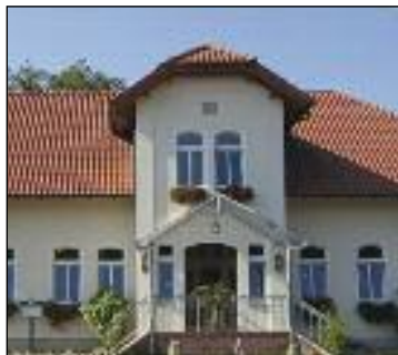
Restaurant Hotel "Pfauenhof"

Inh. Stefan Schröer Projektbetreuung GmbH Bunner Straße 1 - 49632 Essen i. O. Telefon: 0 54 31 - 9 68 80 Telefax: 0 54 31 - 96 88 78 info@pfauenhof-online.de www.pfauenhof-online.de