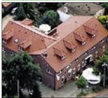
Hotel "Altes Gasthaus Stover"***

Inh. Familie van Ammers Böener Straße 2 49624 Lönningen Telefon: 0 54 32 - 9 44 00 Telefax: 0 54 32 - 94 40 11 info@stover-loeningen.de www.stover-loeningen.de