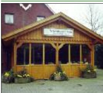
Ferienwohnung "Schelmkapper Krug"

Hunde dürfen gegen eine Gebühr von 2,00 € pro Übernachtung mitgebracht werden.