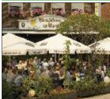
Hotel - Restaurant "Franziskaner am Markt"***

Inh. K. Kulgemeyer Poststraße 10 49624 Lönningen Telefon: 0 54 32 - 25 18 Telefax: 0 54 32 - 90 22 95 info@franziskaner-loeningen.de www.franziskaner-loeningen.de