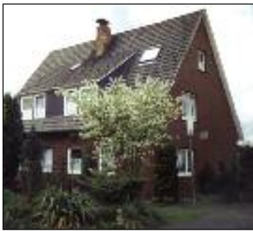
Ferienwohnung "Lammers" ***

Hunde und Haustiere dürfen auf Anfrage mitgebracht werden, Kosten 4,00 - 6,00 €