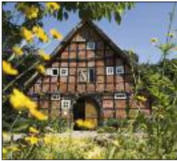
Ferienhof "Hof Am Kolk" ****

Hunde dürfen mitgebracht werden. Preis nach Absprache.